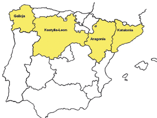
Ryc. 1. Obszary z dynamicznie rozwijającą się hodowlą wielkotowarową świń, Hiszpania, od początku lat sześćdziesiątych ubiegłego wieku (1)