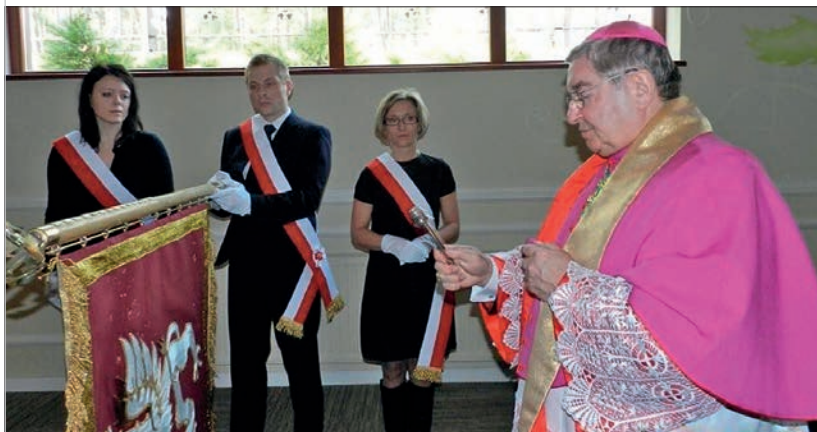
Poświęcenie sztandaru Kaszubsko-Pomorskiej Izby Lekarsko-Weterynaryjnej przez abp. Sławoja Leszka Głódzia